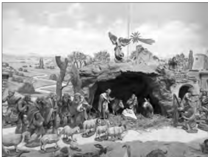
Ein Ausschnitt der großen Roggenburger Klosterkrippe.

Weitere Informationen zu den Landkreismuseen, den Ausstellungen und Veranstaltungen unter: https://www.landkreis-nu.de/Museen