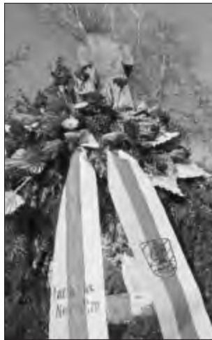
Kranz des Landkreises Neu-Ulm bei der Gedenkfeier am Volkstrauertag auf der Kriegsgräberstätte Reutti